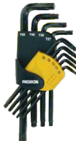
Sada zástrčných kľúčov TORX; 9-dielna