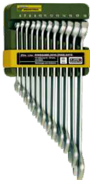
Sada očkových plochých kľúčov 12-dielna