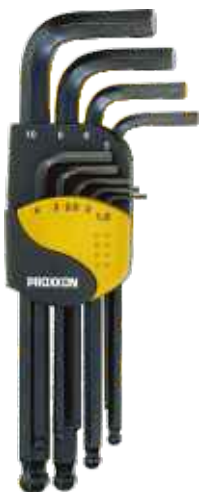
Sada zástrčných kľúčov 6-hran; 9-dielna