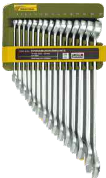
Sada očkových plochých kľúčov 15-dielna