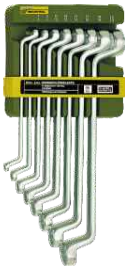
Sada očkových obojstranných kľúčov 8-dielna