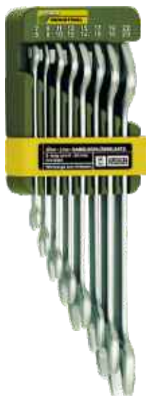
Sada vidlicových obojstranných kľúčov 8-dielna